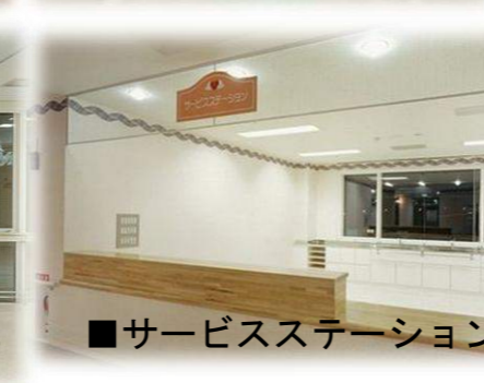
■サービスステーション